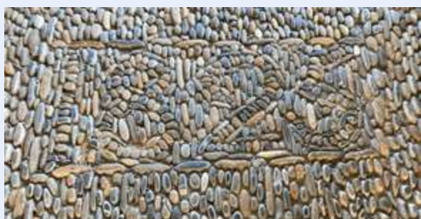
Kunst von Menschenhand (Eingang Kirche)

Gerne möchten wir im Chilefänschter solche Momente miteinander teilen. Schicken Sie dazu ihr Foto mit der Angabe eines Titels oder des Ortes der Aufnahme (möglichst in normaler Auflösung) per Mail an: pamela.wyss@kirchewangen.ch . Und schreiben Sie dazu, ob Ihr Name mit dem Bild veröffentlicht werden kann.